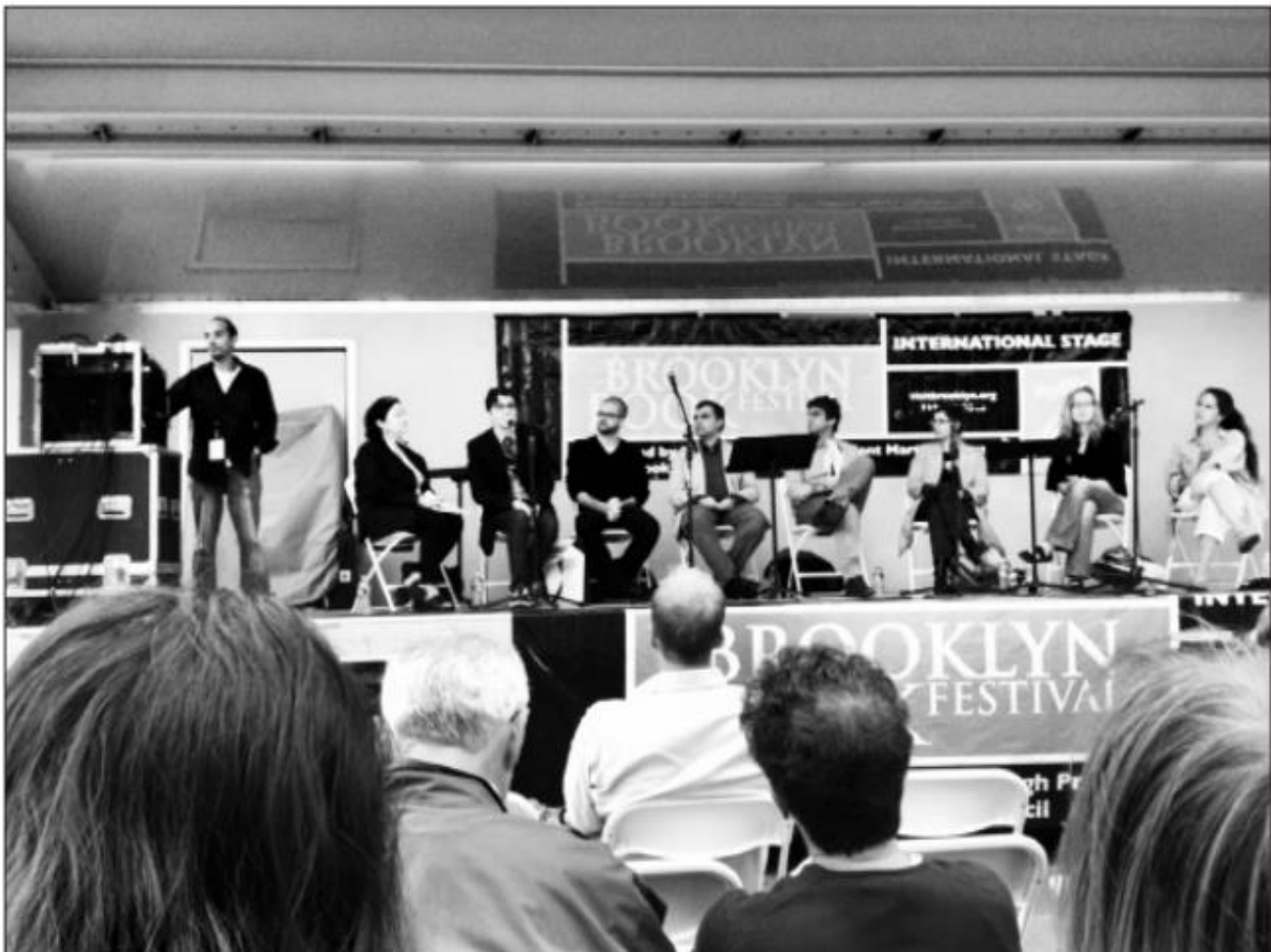
Slika 2. Tribina međunarodne književnosti na Brooklyn Book Festivalu 2010.

Logika tržišta sve se više sučeljava s logikom država koje svojom politikom potpore postaju jamci relativne autonomije polja kulturne proizvodnje u odnosu na tržišne kriterije. Na području kulturnih industrija globalizacija se, naime, ubrzanjem procesa koncentracije, spajanja i pripajanja te internacionalizacijom velikih kompanija prvenstveno očitovala kao naglašavanje komercijalnih ograničenja.