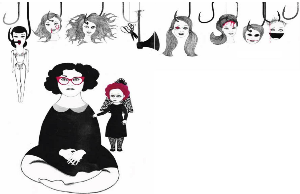
Slika 3: Ilustrirala Sara Morante

Zanimjela je prvi put otkako je poznajem. Oprezno sam pričekala. Nije bilo reakcije, pa sam joj tragičnim glasom saopćila da sam čula liječnika kako govori mojim roditeljima da umirem od tuberkuloze. Tu-ber-ku-lo-ze, izgovorila sam u slogovima. Jako ću smršavjeti i pljuvati krv u maramicu. Neću napuniti ni jedanaest godina. Lutka je to prihvatila nekako nemarno i usmjerila svoj ledeni pogled u neku točku iza mojih leđa, možda u smjeru police koja je pripadala mojoj mlađoj sestri. Te iste noći, dok sam lijegala u krevet, majci sam čudnim odraslim glasom saopćila da sam odlučila s kojim igračkama želim biti pokopana.