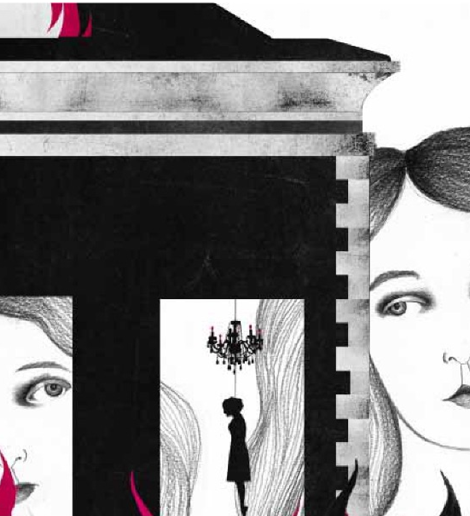
Slika 2: Ilustrirala Sara Morante