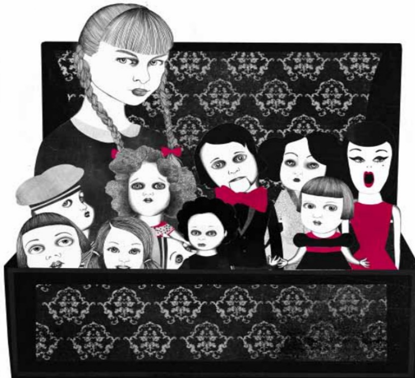
Slika 1: Ilustrirala Sara Morante

Sestra i ja užasnute smo ugledale bakinu kuću lutaka kako gori u kutu naše sobe. Nekako smo jastucima uspjele ugušiti požar pa poput dvaju uznemirenih divova provirile unutra. Plamenovi su zacrnjeli šarene tapete, a ostaci namještaja stršili su kao kostur pougljenjene ptice. Kašljale smo sve do stuba. Prazne oči ogledala zrcalile su samo trag od pepela koji je lebdio u zraku, pa smo malim prstom razvalile vrata spavaonica na drugom katu, strepeći od onog najgoreg. Usamljena