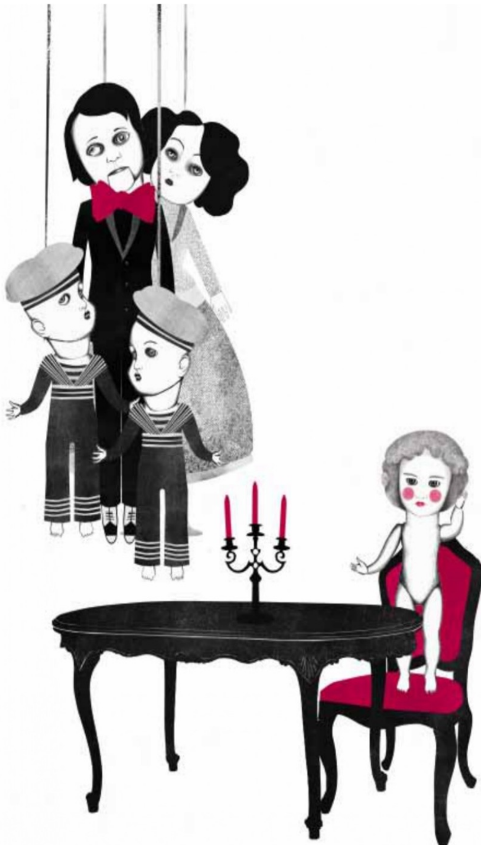
Slika 6: Ilustrirala Sara Morante