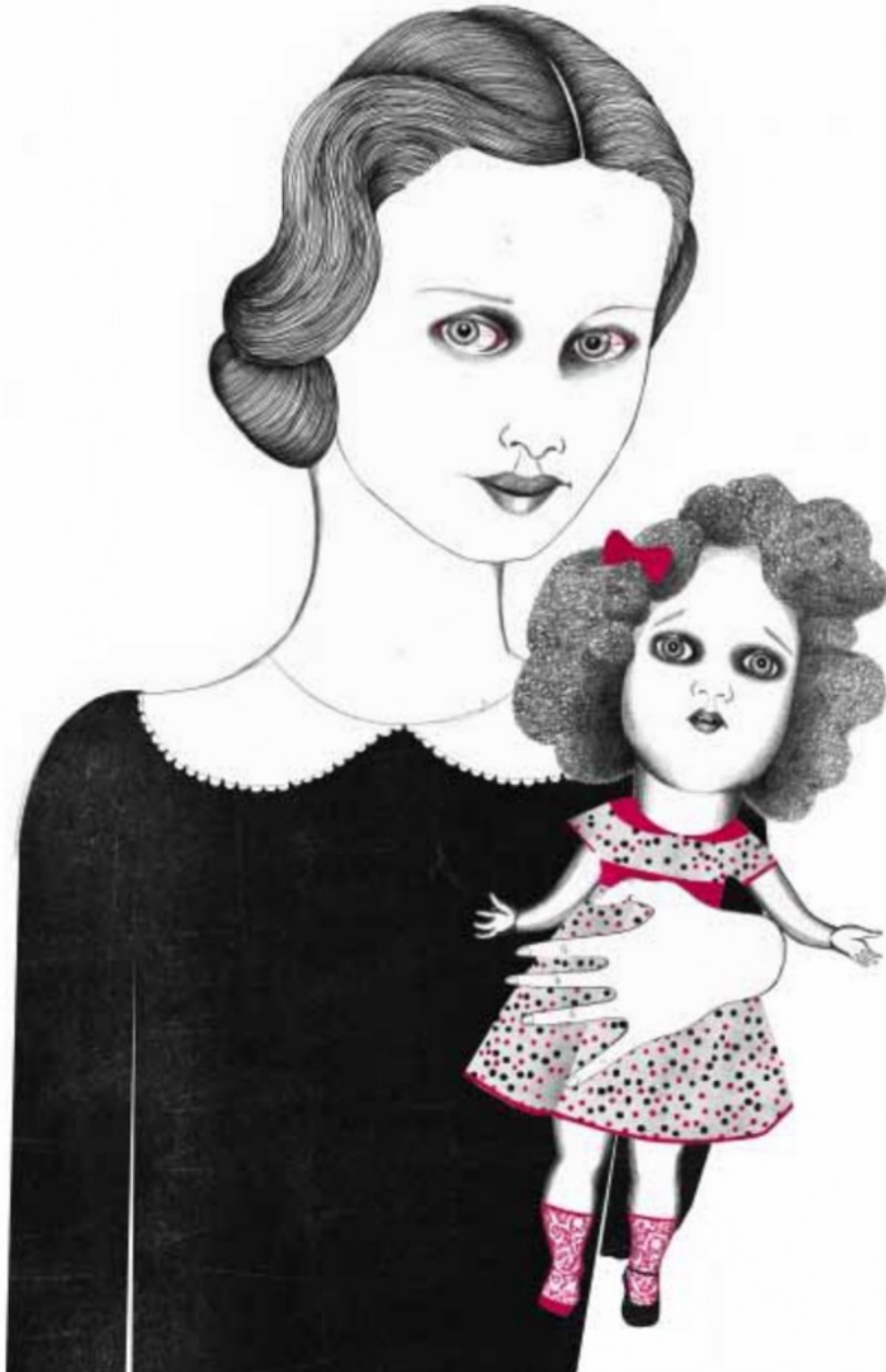
Slika 4: Ilustrirala Sara Morante