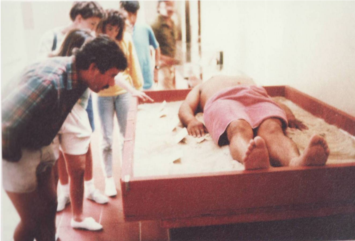
Figure 4: James Luna: The Artifact Piece – 1987. (Luna, 2005:15)

Skrenuvši pozornost na sebe kao artefakt, Luna je jasno razotkrio vezu između institucija znanja Zapada, imperijalizma i kulture spektakla, činjenicu da gledateljeva konzumacija artefaktnog d rugog odražava i održava društvene odnose moći.