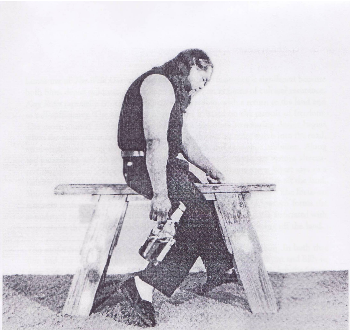
Figure 2: James Luna: The End of the Frail – 1990/91. (Luna, 2001:26)

No, umjesto konja, Luna jaše “jarca” za piljenje drva i drži bocu alkoholnog pića u ruci umjesto koplja. U suvremenoj odjeći, hineći beživotnost i umor, Indijanac dvadeset prvog stoljeća ne samo što afirmira svoju živuću prisutnost ovdje i sada već se i ruga mitu koji ga zamrzava u slike i rezbarije prošlosti. Stotinu godina kasnije “izumirući divljak” očigledno još nije nestao. On je još uvijek tu i iskače iz kolonijalnog okvira u zbilju sadašnjosti, narušavajući imaginaciju koja ga već stoljećima zatvara u mit i prošlost. Za Lunu Fraserova je skulptura dio iste one povijesne imaginacije iskrivljene željom za poetičnom autentičnošću koja je stvorila i film Ples s vukovima, koji je po njemu: