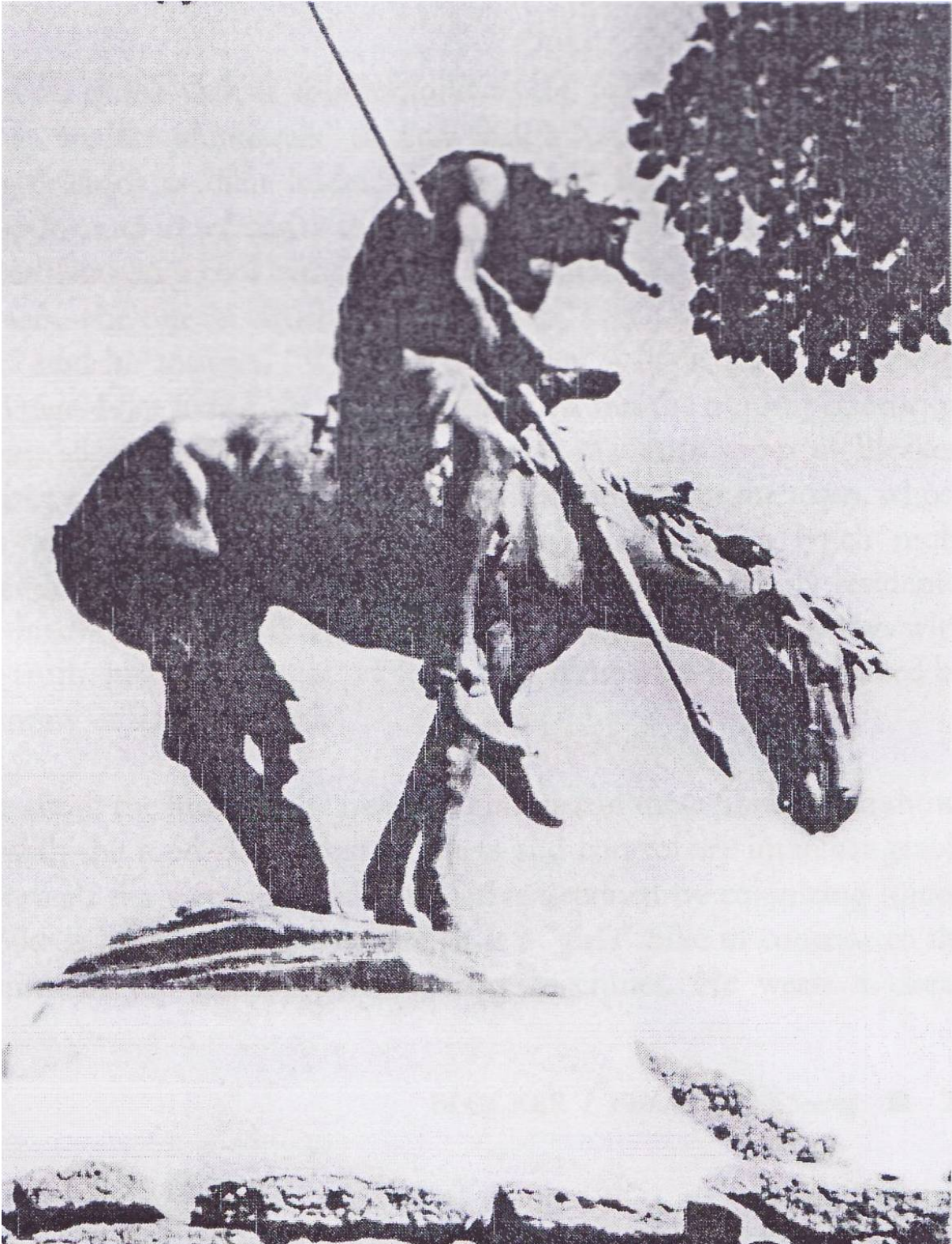
Figure 1: James Earle Fraser: The End of the Trail – 1894. (Fraser 26). [F2]

Prema Vizenoru, upravo je izum fotografije sredinom devetnaestog stoljeća odigrao veliku ulogu u distribuciji izmišljenog indijanstva u dominantnoj kulturi (1998: 152). Fotografije su važan adut u